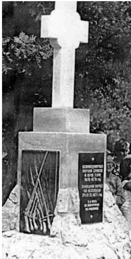
Spomenik na Kosovici

Na mestu Kosovica 2003. godine otkriven je spomenik palim ratnicima u ovoj bici. Brdo Kosovica se nalazi između sela Ladovica i varošice Grdelica. Neposredno pored Kosovice prolazi put koji ide od Vlasotinca, preko Kozara do Grdelice i dalje prema Vranju.