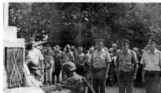
Polaganje cveća na spomeniku