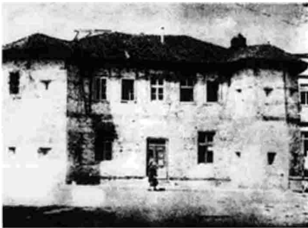
Kula, danas Muzej grada Vlasotinca

Oslobođenje Vlasotinca je bilo delo jednog spontanog, ali dobro organizovanog narodnog ustanka. Postojala je i srećna okolnost da u samom Vlasotincu nije bilo ni turskog