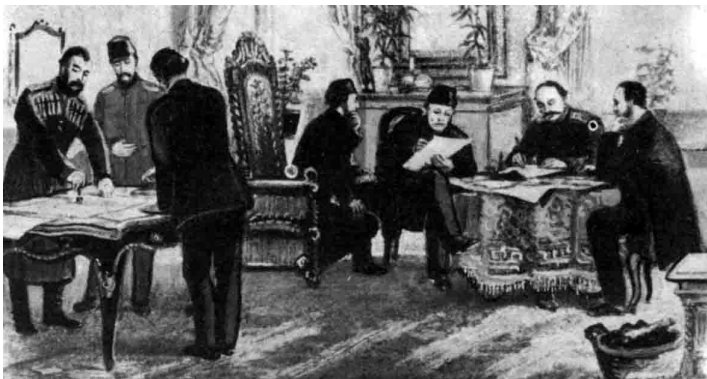
Potpisivanje mira između Rusije i Turske u San–Stefanu (1878. godine)

Vlasotinački kraj je konačno oslobođen od Turaka. Pod pritiskom velikih sila mir između Rusije i Turske zaključen u mestu San–stefanu, marta 1878. godine. Ovim mirovnim ugovorom veliki deo tadašnjeg Vlasotinačkog sreza trebalo je da propadne takozvanoj Velikoj Bugarskoj.