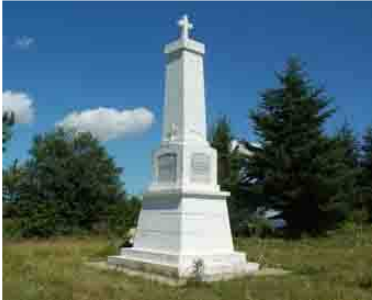
Споменик на Тумби подигнут 1931 године