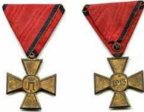
Крст 1913. Споменица учешћа у Другом балканском рату

топа.Са бугарске стране 4.армија,македонско-једренско ополчење,4 дивизије и 3 бригаде (95 батаљона,230 топова),око 130 000 бораца.Битка је завршена српском војничком и војном победом.На српској страни је било око 20 000 мртвих и рањених ,а на Бугарској око 30 000 мртвих , рањених и заробљених.