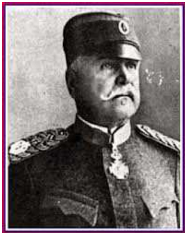
Војвода Степа Степановић командант Друге армије

Бугарски владајући кругови су били најнезадовољнији, одбили су све покушаје мирног решења спора и у журбано се припремали за рат. Уместо да председник бугарске владе Стојан Данев, по наређењу генерала Савова, односно цара Фердинанда на преговоре, бугарске трупе су изненада 30. јуна 1913. нападе Србију и Грчку.