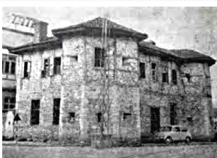
Турска кула у Власотинцу

Миром у Сегедину од 1444. године Турци су вратили Ђурђу Бранковићу (наследнику деспота Стефана Лазаревића) чија је престоница била у Смедереву: Крушевац, Копријан, Прокупље, Лесковац и Зеленград. Турци су први пут заузели Смедерево 1439. године, али на кратко време. Султан Мехмед Други је освојио Цариград 1453. године па је наставио да заузима територију Србије. Циљ му је био да заузме Ново Брдо. За одбрану у Србији су формиране две војске, једна у Дубочици а друга на Ситници. Српском војско у Дубочици командовао је Никола Скобаљић који је 24. септембра 1454. године у бици код Бање (место није тачно лоцирано) победио турску војску. Султан је после тога одлучио да сам поведе војску на Дубочицу. Скобаљић се повукао ка својој тврђави код Вучја. Ту је пружио отпор, али је на води Трепињи код места Кистине поражен, заробљен и заједно са стрицем, 16. новембра, Турци су их набили на колац и на тај начин овај крај је коначно пао под Турцима.